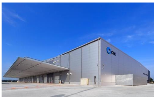
5 ロジスクエア羽生 2016年7月竣工