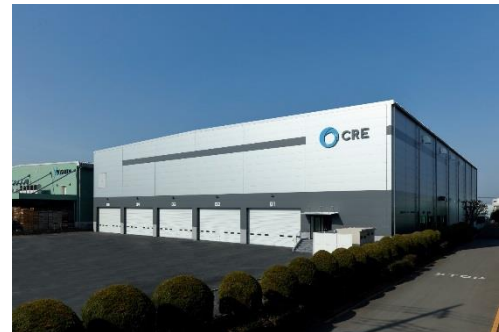
12 ロジスクエア川越 2018年2月竣工