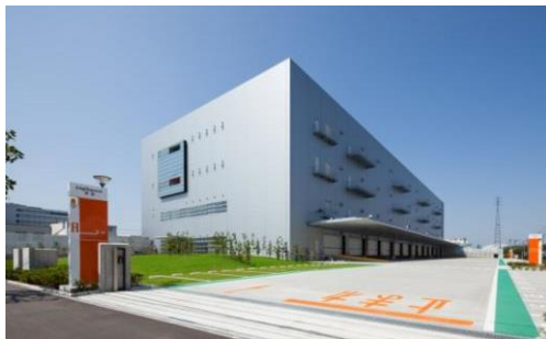
1 ロジスクエア草加 2013年6月竣工