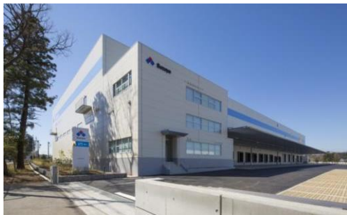
3 ロジスクエア日高 2015年3月竣工