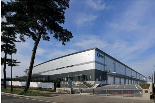
9 ロジスクエア守谷 2017年5月竣工