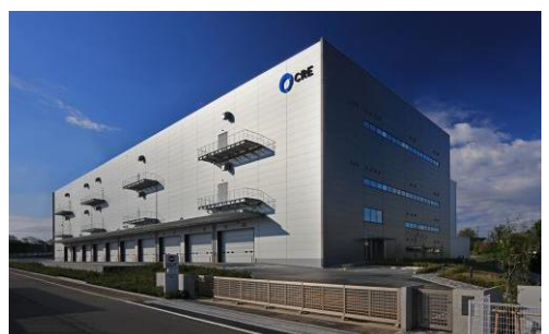
8 ロジスクエア新座 2017年4月竣工