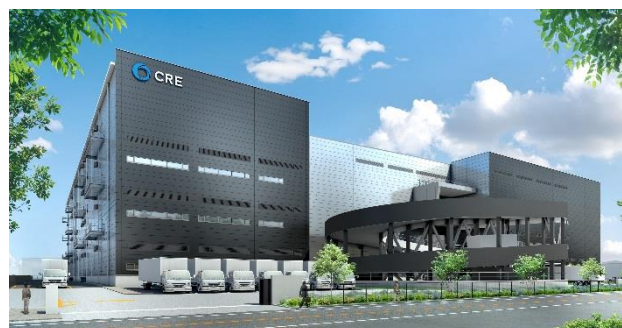
19 ロジスクエア大阪交野 2021年1月竣工予定