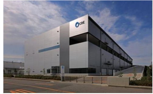
4 ロジスクエア久喜 2016年6月竣工