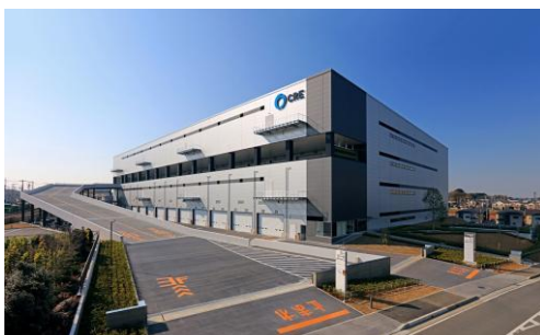
7 ロジスクエア浦和美園 2017年4月竣工