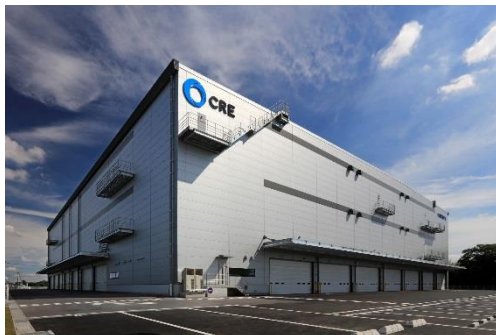
13 ロジスクエア春日部 2018年6月竣工