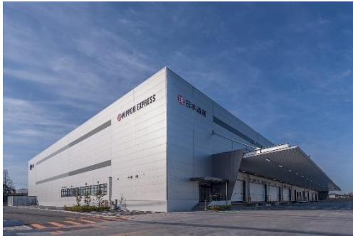
11 ロジスクエア鳥栖 2018年2月竣工