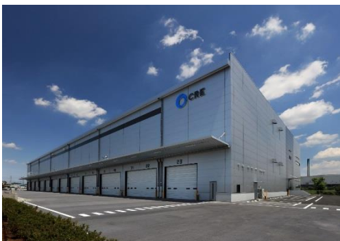
15 ロジスクエア川越Ⅱ 2019年6月竣工