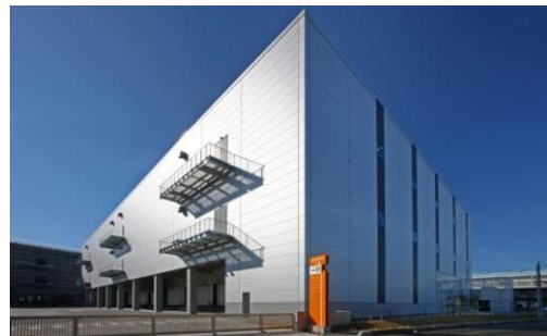
2 ロジスクエア八潮 2014年1月竣工