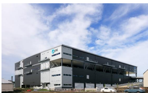
17 ロジスクエア三芳 2020年6月竣工