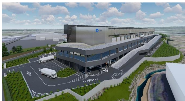
18 ロジスクエア狭山日高(飯能) 2020年6月竣工予定