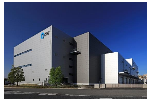
14 ロジスクエア上尾 2019年4月竣工