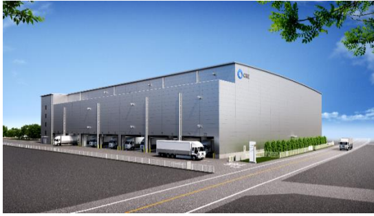
20 ロジスクエア三芳Ⅱ 2021年3月竣工予定