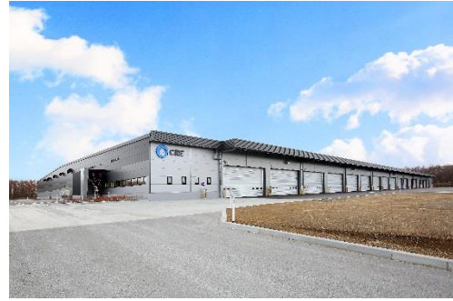
10 ロジスクエア千歳 2017年12月竣工