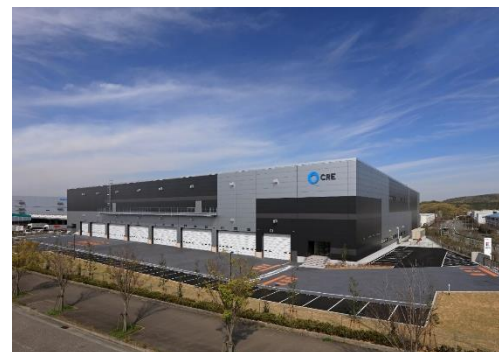
16 ロジスクエア神戸西 2020年4月竣工