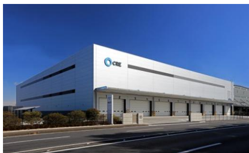
6 ロジスクエア久喜Ⅱ 2017年2月竣工