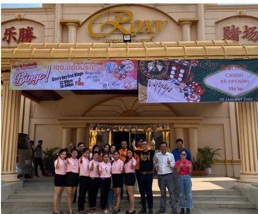
ビンゴカジノ場 現地人スタッフ一同

当社は、オンラインでビンゴゲームを楽しむことができるオンラインビンゴシステムを開発し、グアムにおいてシステムライセンスを提供しております。また、2020年1月21日付「アクロディアのオンラインビンゴシステムを利用した子会社直営のビンゴカジノ場が 1/19 にソフトオープン！！」にてお知らせしましたとおり、カンボジア子会社による直営ビンゴカジノビジネスに進出し、2020年1月19日にソフトオープンを行いました。ソフトオープン後には会場に入りきれないほどのお客様が来場し、入場制限するほどの大盛況となりました。その後も連日多数のお客様が来場していただいておりますが、予定通り、1月23日にグランドオープンを行いました。