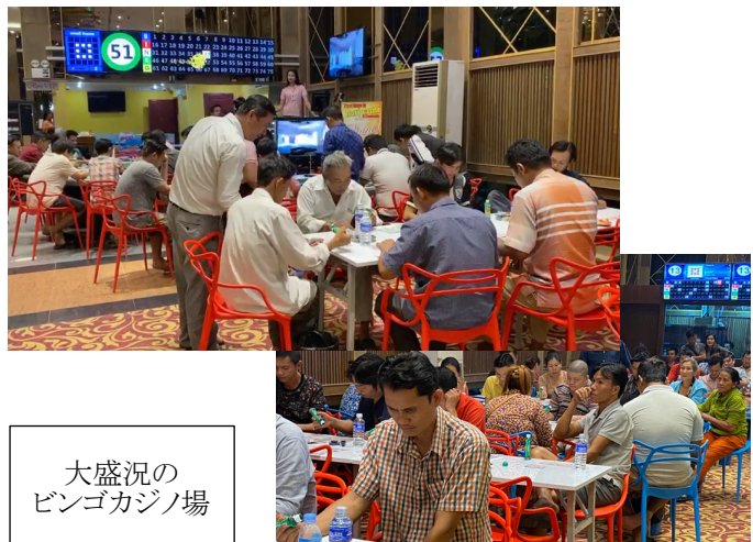
大盛況の ビンゴカジノ場