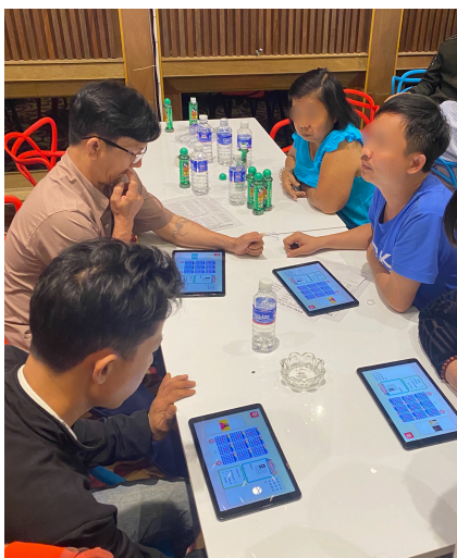
当社開発のビンゴシステムによるプレイ風景