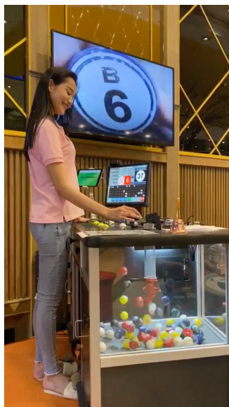
公認ブローマシからボールを取り出すコーラー

グランドオープンにあたっては、VIP 版として提供している当社のオンラインビンゴシステムを設定したタブレットの運用を本格化し、今後の収益化につなげてまいります。