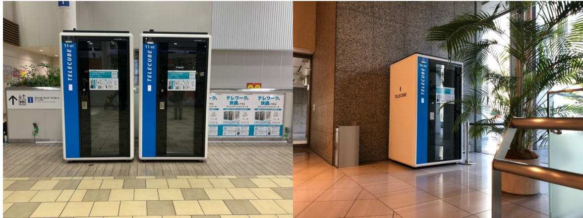
(写真左:西武鉄道所沢駅、写真右:山王パークタワービル)