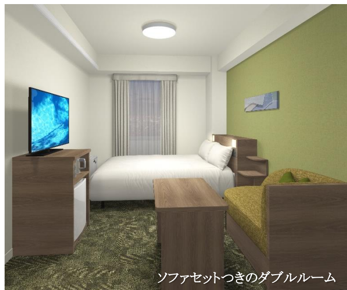
ソファセットつきのダブルルーム