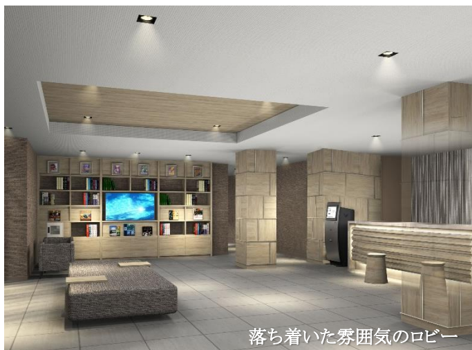
落ち着いた雰囲気のリビー

「たびのホテル倉敷水島」は、自社ホテルブランド「日和（ひより）ホテルズ&リゾーツ」のカジュアルブランドであり、手軽に旅を楽しみたい方やビジネスで滞在する方へ向けた宿泊特化型ホテル「たびのホテル（TABINO HOTEL）」の国内3号店として、岡山県倉敷市水島に誕生いたします。