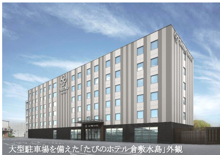
大型駐車場を備えた「たびのホテル倉敷水島」外観

当社および連結子会社であるサンフロンティアホテルマネジメント株式会社は、2020年2月1日に開業を予定している「 たびのホテル倉敷水島 」の宿泊ご予約承りを開始いたしましたので、お知らせいたします。