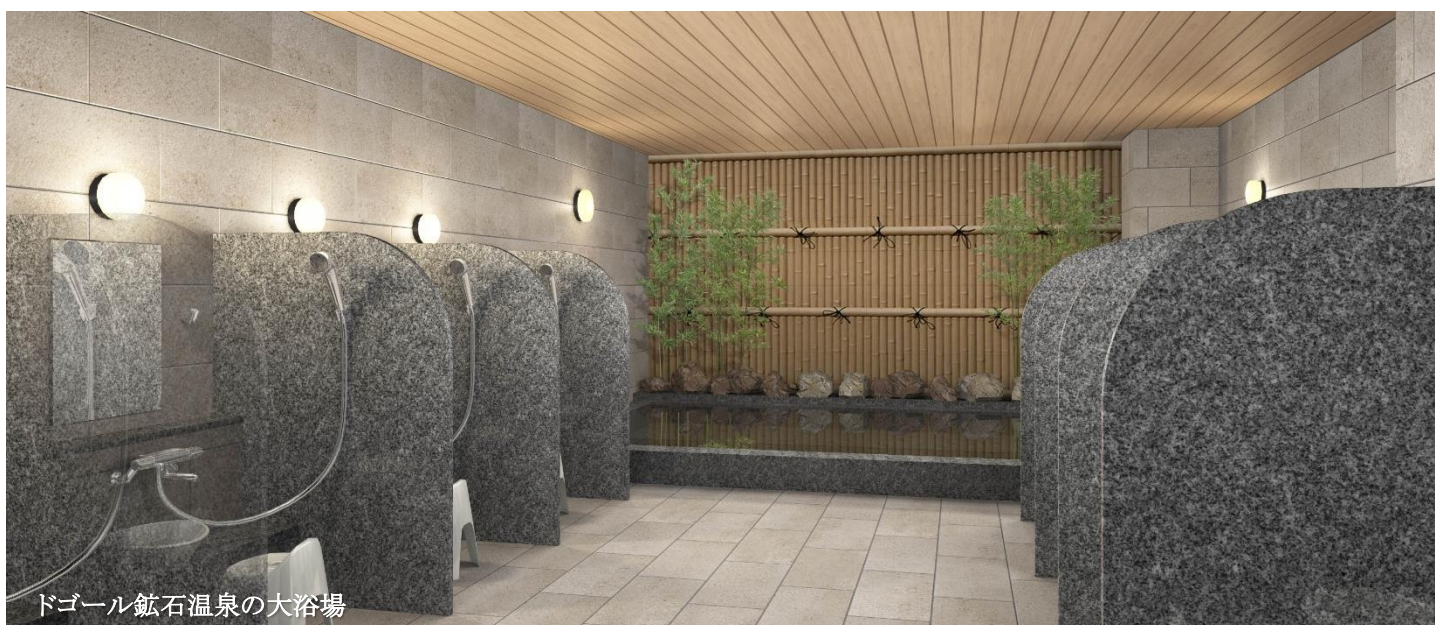
ドゴール鉱石温泉の大浴場