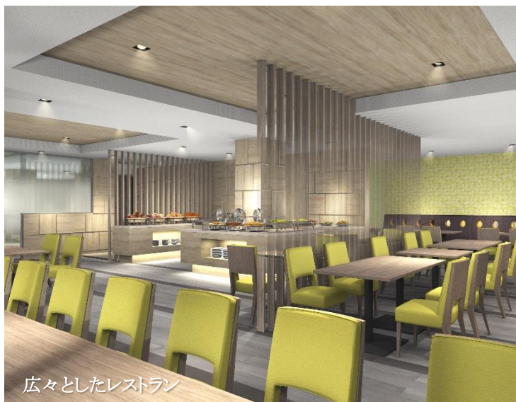
広々としたレストラン

さらにレストランでは岡山県の B 級グルメを集めた「大満足モーニング」など、この地域ならではのメニューを企画しています。「たびのホテル倉敷水島」は、心温かい従業員によるおもてなしで、お客様お一人おひとりに寄り添い、パーソナルなサービスと癒しの時間、空間をご提供させていただくことを通して、「また帰ってきたいホテル」を目指してまいります。