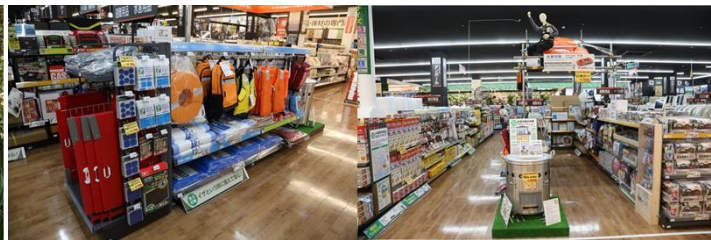
〈防災用品は災害種別に必要な商品を提案〉