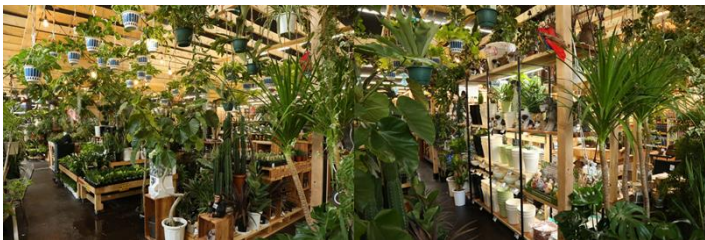
〈一点モノ観葉を多数揃え、インテリアとしてグリーンを提案〉