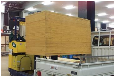
〈フォークリフト積み込み〉