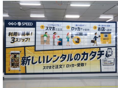
<ロッカー イメージ>

ゲオではこれまで実店舗とオンライン環境のシームレス化を推進しており、実店舗でのレンタルだけでなく、インターネットで注文し自宅で商品を受け取る宅配レンタルサービスなどを展開してきました。生活スタイルの多様化により、空き時間や通勤途中に「簡単にスマートフォンで注文したい」、会社・学校帰りに「受け取るだけ」にしたい、「誰にも会わずにレンタルしたい」など、ユーザーのニーズも多様化しています。