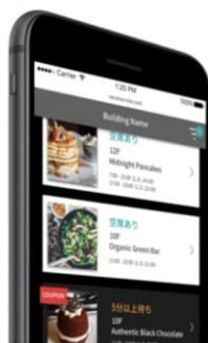
※スマートフォン表示画面イメージ

これにより、9Fのレストランフロアまで行かなくても、混雑状況を確認できるので、お客さまに「行ってみたけどダメだった」という思いをさせない「スマートなレストランフロア」となります。