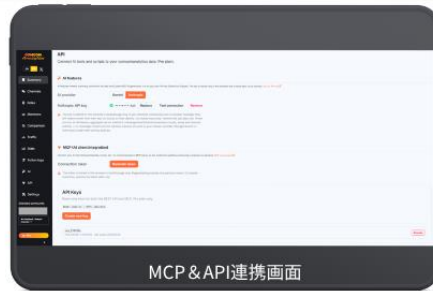
MCP & API連携画面