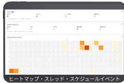
ヒートマップ・スレド・スケジュールイベント