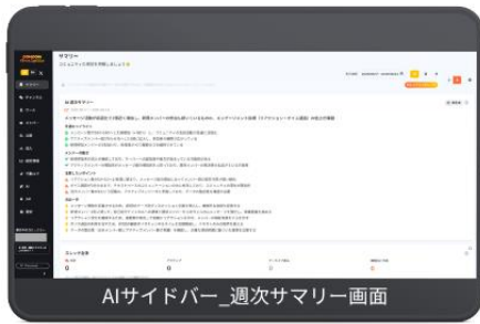
AIサイドバー_週次サマリー画面