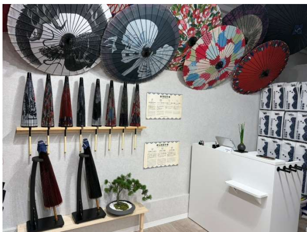
『江の島すばな通り 北斎グラフィック』店内