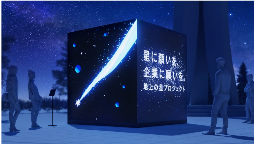
インスタレーション体験イメージ（タブレットで願いを入力すると願いを叶えた自分の姿が表示）

ソラマチひろばに、キューブ型のインスタレーションを設置します。設置されるタブレットからご自身の写真を撮影し、星への「願い」を入力すると、その願いが叶った未来の中にご自身が現れる演出をお楽しみいただけます。昼からまたたく星空や流れ星とともに、願いが叶う未来を体験できる参加型コンテンツです。