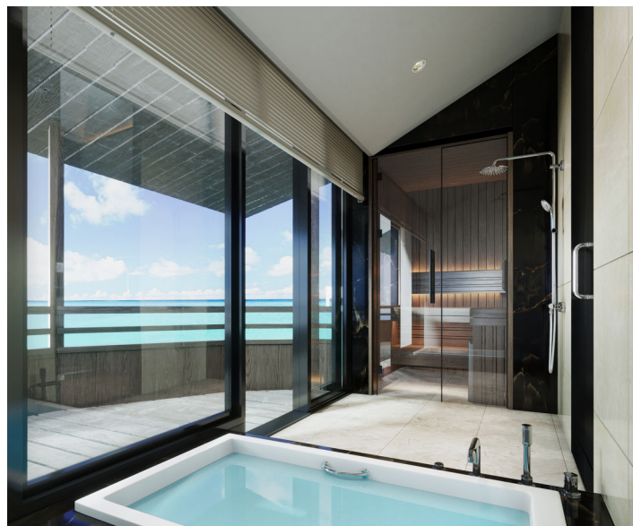
【客室：ロイヤルスイート】（上）リビング&ベッドルーム/（左）ベッドルーム/（右）バスルーム