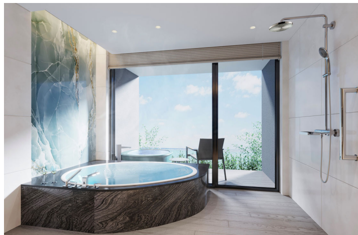
【客室：ロイヤルスイート】(上) リビング&ダイニングルーム/ (左) ベッドルーム/ (右) バスルーム