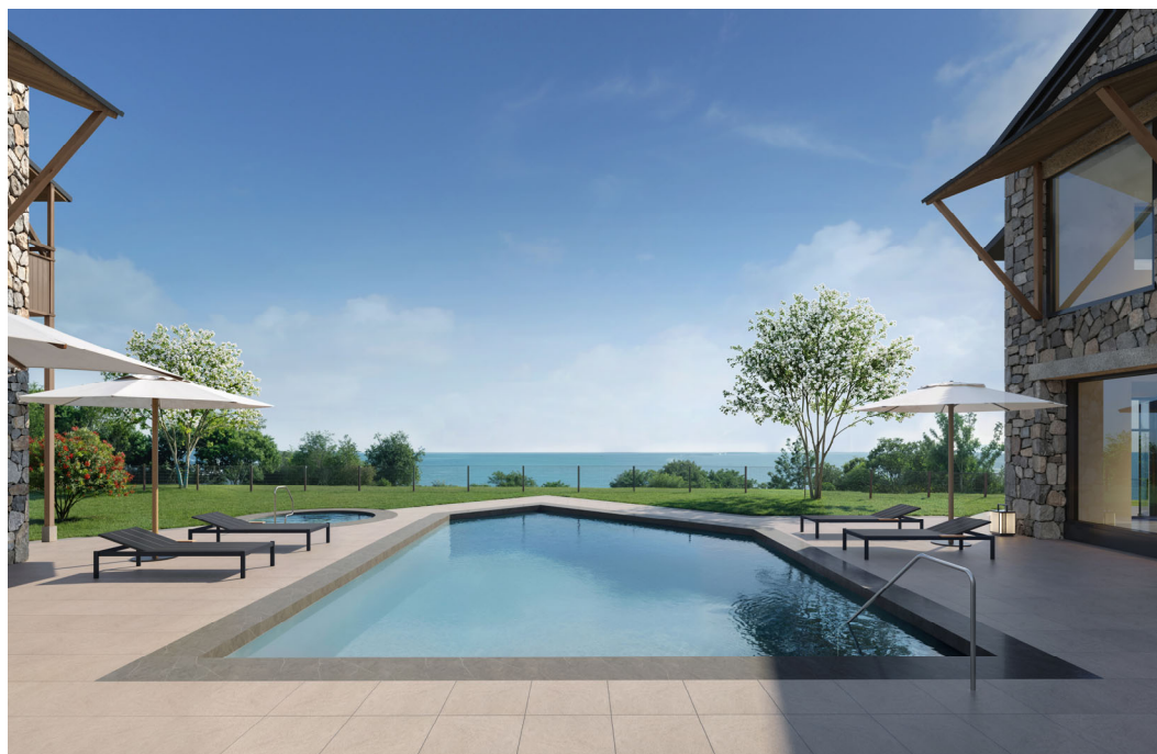
アウトドアプール