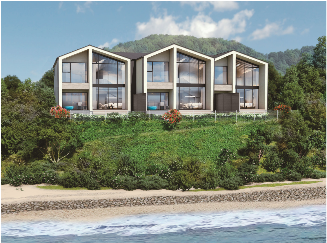
レジデンス棟外観