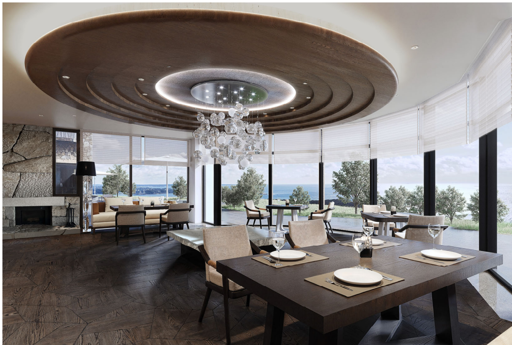
レストラン・バー