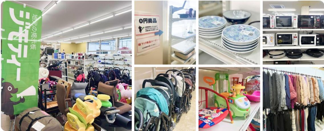
ジモテースポットの様子(写真は他店舗の様子)