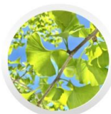
イチョウ葉エキス *3