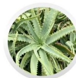
アロエベラ葉エキス *2