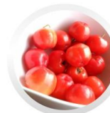
アセロラ果実エキス *1