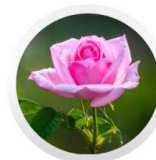
センチフォリアバラ花水 *4