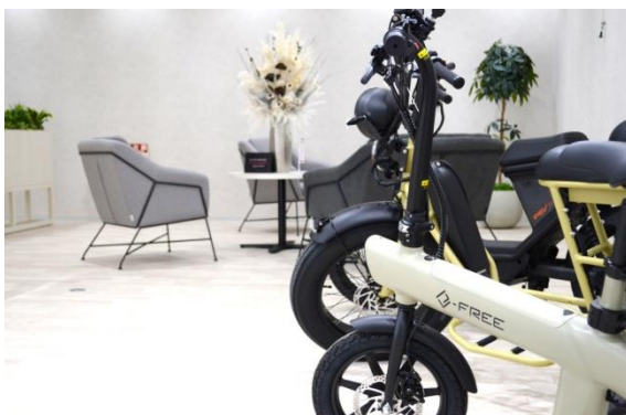
電動モビリティの展示