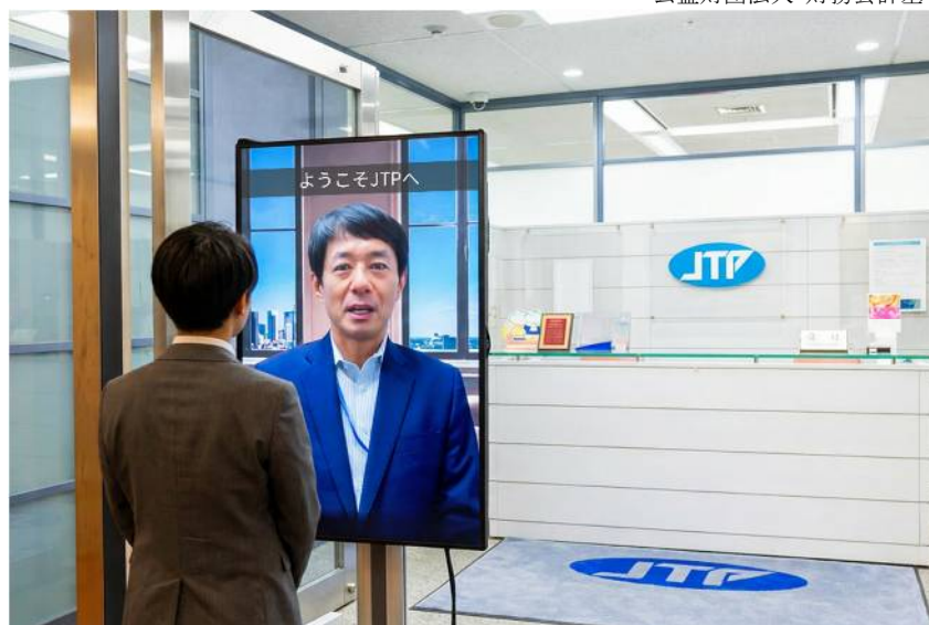
「AI アバター」活用イメージ

※本画像は、「Third AI 生成 AI ソリューション」で作成したコンセプトビジュアルです。