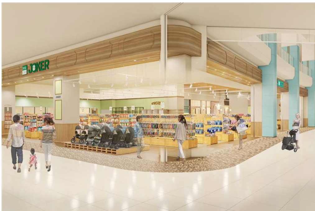
【DOG&CAT JOKER ユニモチはら台店イメージ図】