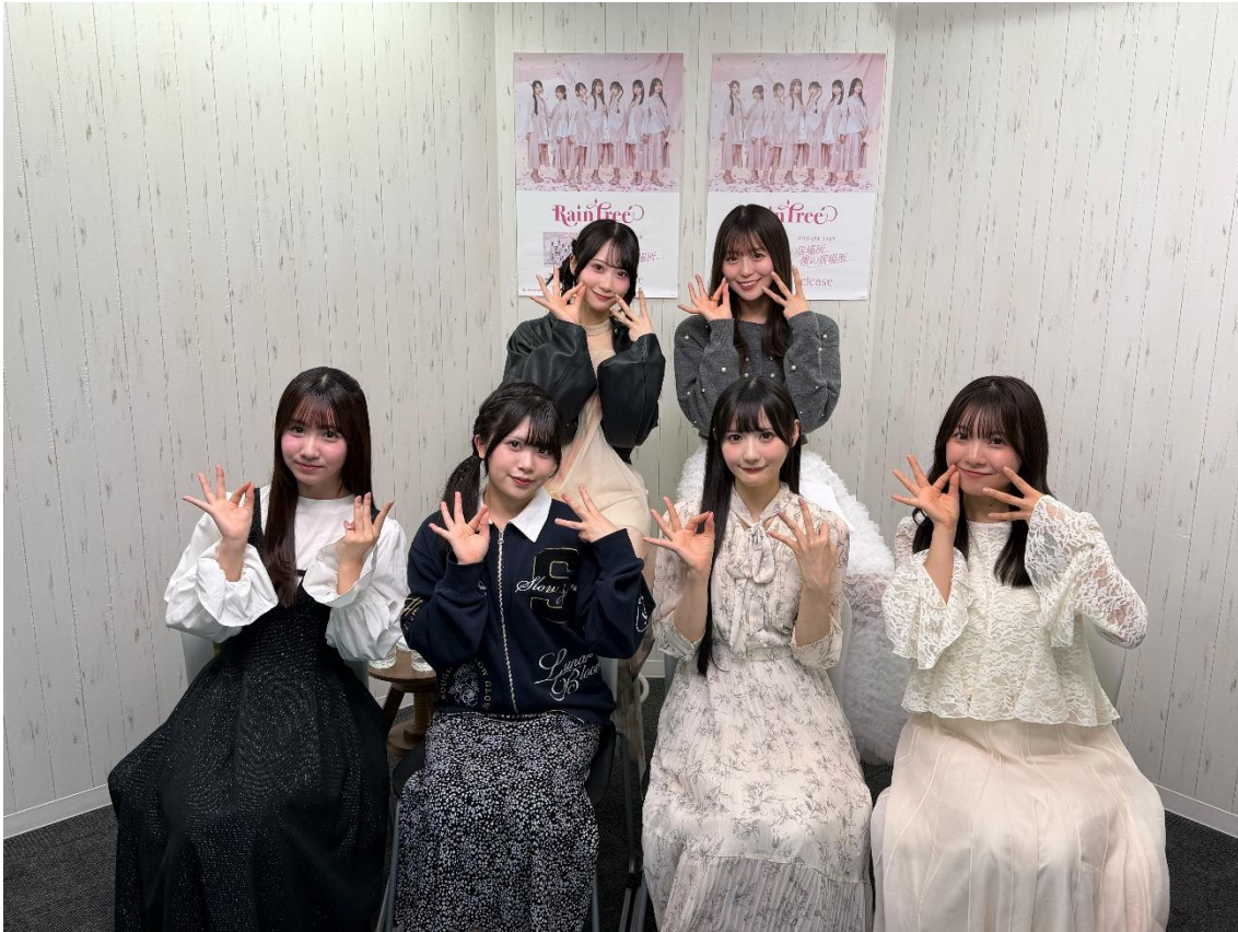
▲オンラインイベント後の様子