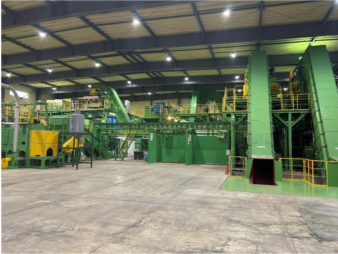
プラスチック高度選別施設