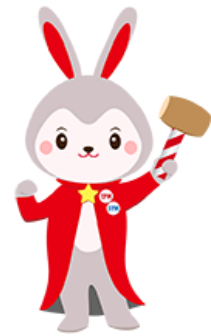
日本M&Aセンター 市場支援サービスキャラクター TIPPY☆多 ティッピー

オカダコーポレーションは、日本 M&A センターが担当 J-Adviser として TOKYO PRO Market へ市場した第 57 号銘柄です。