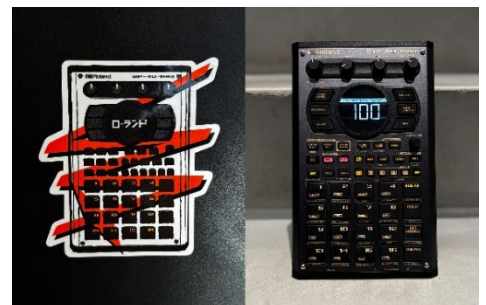
購入者プレゼント・ステッカー (左) と「SP-404MKII」特製フェイスプレート (右)