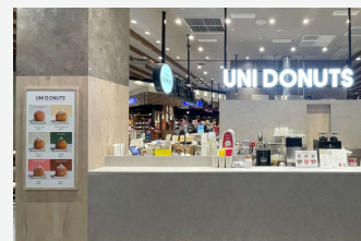
UNI DONUTS イオンモール大日