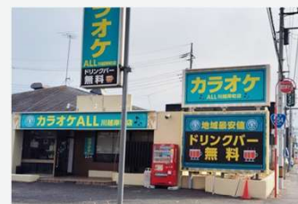
カラオケALL川越岸町店