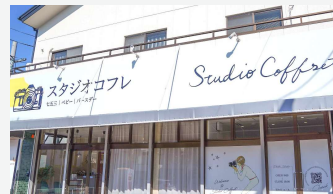
スタジオコフレ名古屋名東スタジオ

3日、株式会社キャラットが展開するプライベート型フォトスタジオ「スタジオコフレ」の48店舗目、愛知県4店舗目となる「スタジオコフレ名古屋名東スタジオ」がオープンしました。「スタジオコフレ」は、お子様の成長の軌跡を、特別な空間でリラックスして撮影できるフォトスタジオです。コフレオリジナルの衣装と、ご家族だけで貸し切りのできるプライベート空間が好評。名古屋駅や栄駅からアクセスしやすい立地で、オープン後は想定約2倍のお客様が来店され、好調なスタートを切りました。