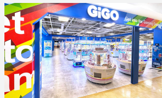
GiGOヴィータモールせいせき

12日、東京都多摩市の聖蹟桜ヶ丘駅直結の商業施設6階に「GiGOヴィータモールせいせき」がオープンしました。クレーンゲームやプリントシール機など日々楽しめる構成で、オープン後はファミリーや学生が多数来店し、順調なスタートを切りました。27日には神奈川県茅ヶ崎市の大型商業施設3階に「GiGO BLiX茅ヶ崎」がオープン。駅前でき古くから親しまれてきた施設が新たに生まれ変わり、最新クレーンゲーム機「GiGO CRANE」やプリントシール機などを多数設置しています。「茅ヶ崎に遊べる場所ができて嬉しい」と、若い夫婦やファミリーを中心に想定約4倍のお客様が来店され、連日賑わっています。