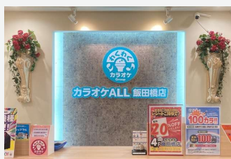
カラオケALL飯田橋店

1日、株式会社メロ・ワークスが運営するカラオケ施設「カラオケALL」等62店舗が仲間入りしました。東京・神奈川・埼玉・千葉・群馬で展開する62店舗が合流することで、双方の人的資源やDXにかかる知見の共有、消耗品などの共同購買による店舗運営効率の向上が期待されます。同時に、アミューズメントでの取引網を活用したIPコラボの実施やフード&ビバレッジで展開する飲食物の提供など、新たなサービスの展開により、新規顧客の集客と顧客満足度の向上が期待できます。