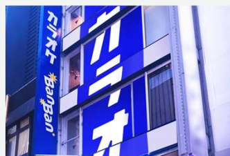
カラオケBanBan歌舞伎町一番街店