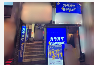
カラオケBanBan上野駅前通り店