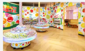
FUN VILLAGE in TOKYO-BAY

28日、千葉県船橋市の「ららぽーとTOKYO-BAY」に、お菓子メーカー「サクマ製菓」とGiGOがコラボレーションしたファミリー向け屋内パーク「FUN VILLAGE in TOKYO-BAY」がオープンしました。サクマ製菓のキャンディ「いちごみるく」をテーマにしたコンテンツを体験できる屋内パークです。懐かしいお菓子のイメージで囲まれた「レトロかわいい」パーク内は「映える」と評判で、お子様連れのファミリーだけでなく、Z世代から大人まで、サクマ製菓のキャンディの世界をお楽しみいただいております。