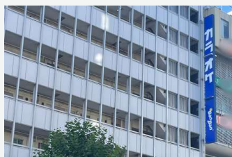
カラオケBanBan高田馬場店