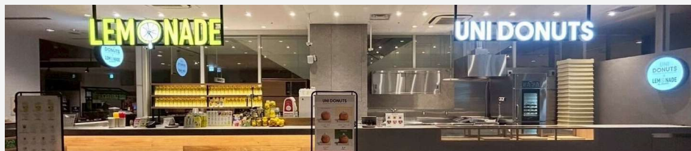
LEMONADE by Lemonica ピオレ姫路店 ・ UNI DONUTS ピオレ姫路

株式会社Sweet Pixelsが3店舗をオープンしました。7日、兵庫県姫路市の姫路駅にある駅ビル「ピオレ姫路」の地下1階に「LEMONADE by Lemonica ピオレ姫路店」と「UNI DONUTS ピオレ姫路」が並んでオープン。25日には大阪府守口市の「イオンモール大日」1階に「UNI DONUTS イオンモール大日」がオープンしました。独自製法の本格レモネードを提供する「LEMONADE by Lemonica」と、横浜発の「ふわふわとろける」生食感の生ドーナツ専門店「UNI DONUTS(ユニドーナツ)」は、ショッピングに訪れたお客様にもたいへん好評です。