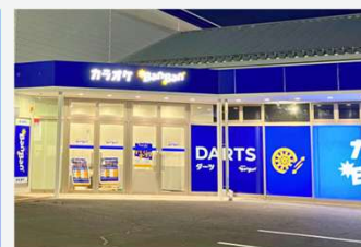
カラオケBanBan佐久平店