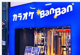
カラオケBanBan川崎銀柳街2号店