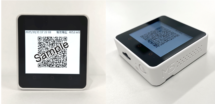
図 2 『ポケット QR』の実機

この度、店舗環境や運用に合わせた選択肢を増やすため、専用端末『ポケット QR』導入に至りました。これにより、スマートフォンまたはタブレットをご用意いただけない店舗でも、可変二次元コードを使った来店確認の機能(ポイント付与やスタンプカードへの押印)がご利用いただけます。