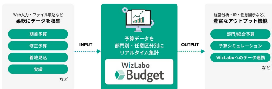
〔WizLabo Budget の全体構造〕

会社法や金融商品取引法といった法律で定められた厳格なルールや規則が存在する財務会計とは異なり、自由度の高い管理会計の予算管理業務は、その特性ゆえに業務標準化が進まず、多くの企業で Excel を中心に作業が行われています。結果、データの散逸、非効率、属人化といった課題が慢性化し、生産性向上や働き方改革の阻害要因となっています。クラウド型予算管理システム「WizLabo Budget」では、着地予想シミュレーションや KPI 情報の収集・レポートなど豊富な機能が搭載されており、予算作成業務の効率化、高度化をご支援いたします。