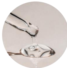
高純度スクワラン

さらに肌なじみの良いホホバオイル(保湿成分)を配合することで、仕上がりはサロン帰りのような、もっちりとなめらかな肌。