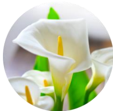
カラ-花酵母エキス* (乾燥ストレスにアプローチ)

クレンジングが豊かな時間になるよう厳選した3つの成分で素肌が解放されるリラックスタイムへ。