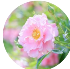
センチフォリアバラ花エキス (幸福感へアプローチ*)

*カラ-花酵母エキス:加水分解酵母 *幸福感へアプローチ:汚れを落とすことによる *いずれも保湿成分( \alpha ピネン除く) ※画像はイメージ