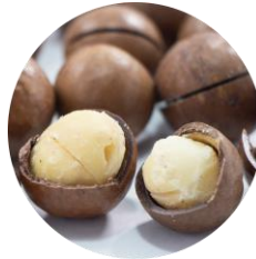
マカデミアナッツ油