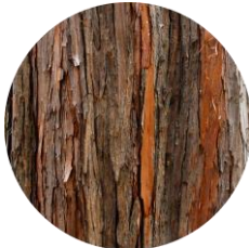
香気成分「 \alpha -ピネン」含有 (樹皮に含まれる香気成分)