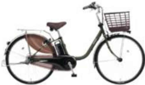
Panasonic ViVi DX