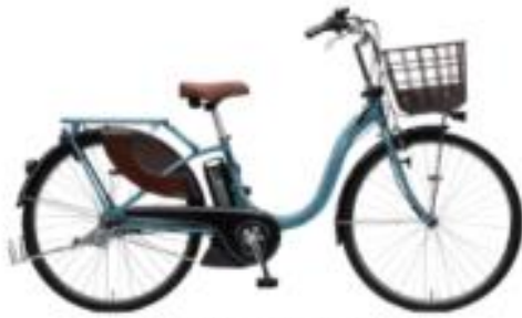
YAMAHA PAS With