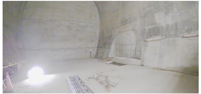
トンネル奥で倒れている人を発見する様子