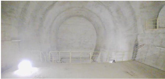
大規模空洞内での飛行

また、神戸市消防局からは、今回の訓練を通じ、当社ドローン「IBIS2」が狭小空間での災害対応に有効であるとの高評価を頂いています。飛行準備から救助対象者の発見までの時間が短く、安全性の向上にも貢献したことが実証されました。