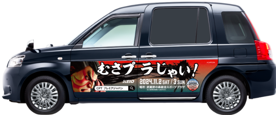
ラッピングイメージ

「Be Smart Tokyo」プロジェクトにおいては、Essenの「WithDrive」を京王自動車保有する10台のタクシーに実装し、大会ビジュアルで車両をラッピング。調布市を中心に大会開催までの約1ヶ月間、走行します。