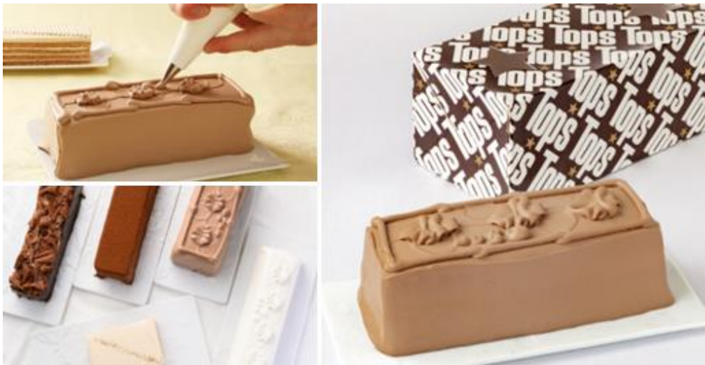
お客様の笑顔を想い、安心・安全な商品と真心のサービスで感動をお届けします。

(トップス: https://www.akasaka-tops.co.jp/ir/ )