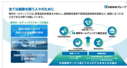
強固な事業インフラで安定した医薬品供給を実現 業界最高レベルの品質・安全管理と効率的な物流 独創的なシステムやサービスの開発・提案

人口減少・労働力不足・災害の頻発化・激甚化 さまざまな社会課題に対応できる、新たな医薬品物流の構築を実現します