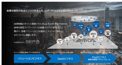
複数のドローン・ロボットを統合管理するシステムプラットフォーム 日本全国のドローンパイロットプラットフォーム運営 ドローンやドローンポートを活用した災害時支援の豊富な実績