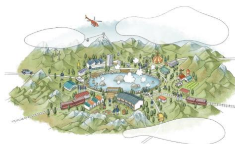
「北欧、暮らしの道具店」イメージ図。独自の世界観を体験できるリゾートパークのようなプラットフォームへ。