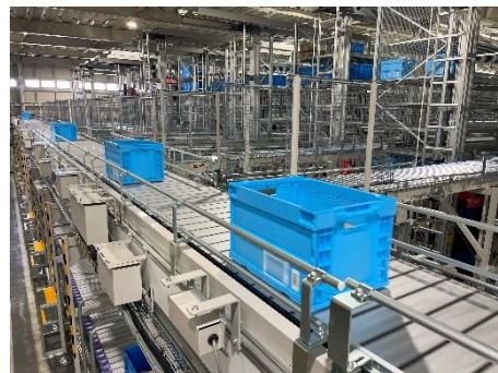
ケース立体自動倉庫「ファインストッカー」

スタッカークレーンが商品の入ったコンテナや段ボール箱などを棚に自動で運び、保管する自動倉庫。作業者の元に商品が搬送される、Goods To Person の考え方を実現した仕組みになっています。高さ 5.5m の空間を有効活用でき、労力と人員を削減するだけでなく、在庫管理精度の向上などにも繋がります。当社が導入した自動倉庫は、最大 22,000 個のケースまたは折りたたみコンテナ（オリコン）を収納することができ、様々なサイズのケースやオリコンの格納に対応しています。