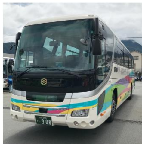
亀の井バス株式会社