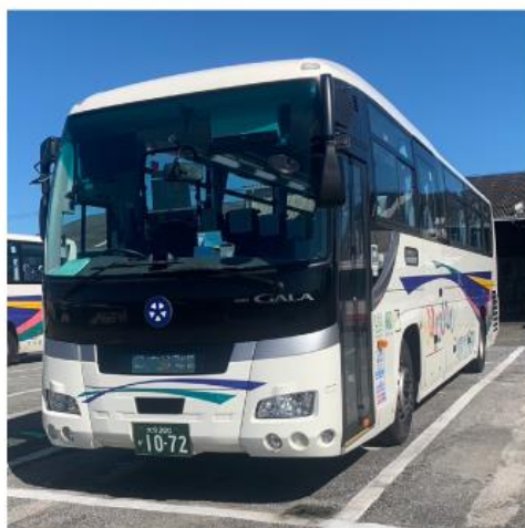
大分交通株式会社

本サービスにおきまして、モバイルクリエイトは実証実験参加各社と協力し、インバウンド観光客を含む国内移動における利便性の向上に努めてまいります。