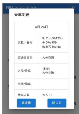
乗車明細・領収書発行画面