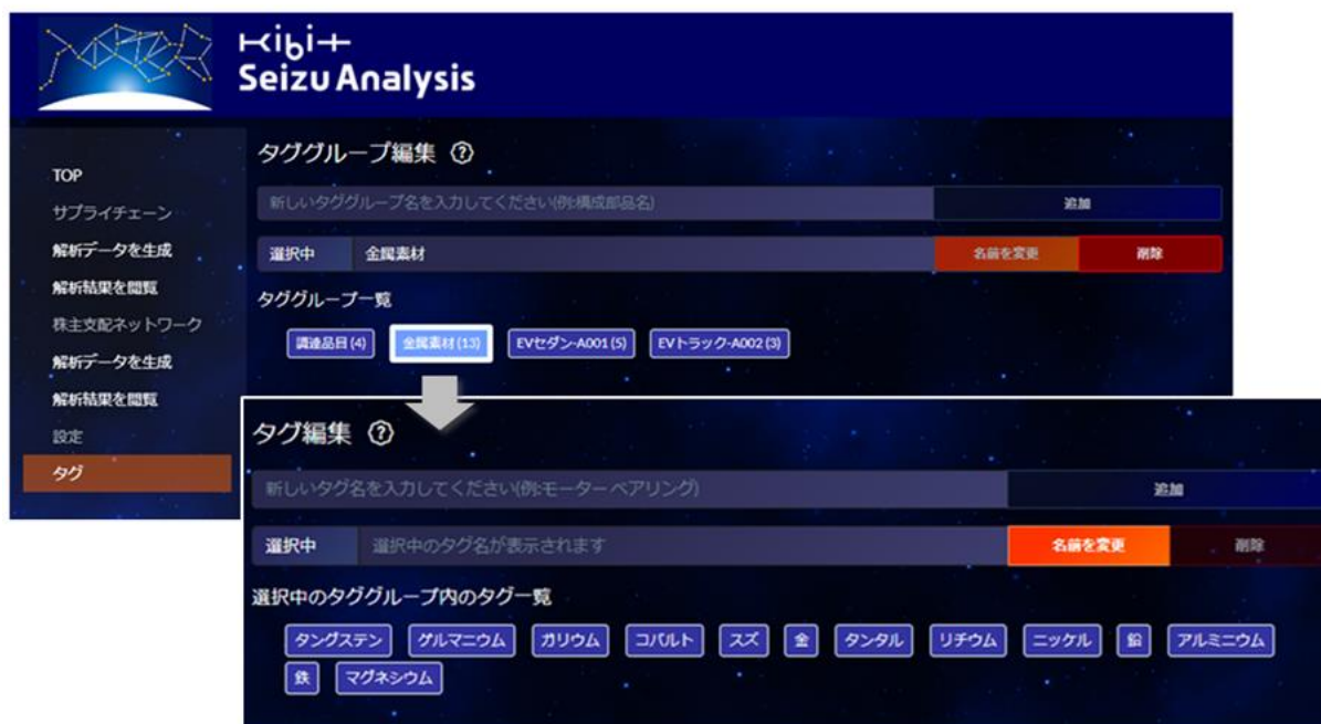
図2：自動車メーカーにおけるタググループ／タグの設定例