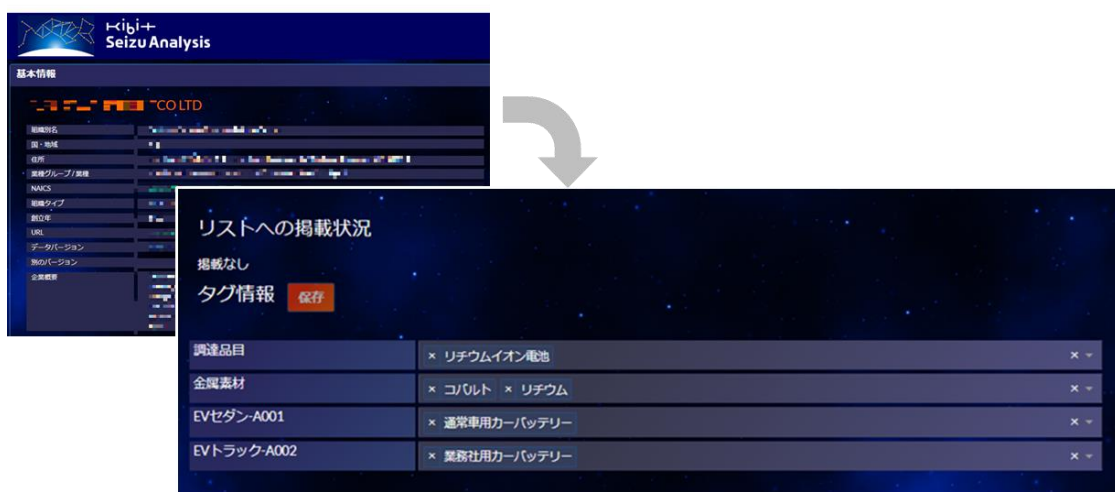
図3：自動車メーカーのTier1バッテリーメーカーへのタグ付け例