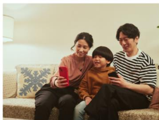
▲ アプリから1度だけ顔登録

※2 北海道、東京都、神奈川県、埼玉県、千葉県、愛知県、京都府、大阪府、広島県、福岡県、熊本県、沖縄県