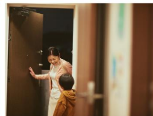
▲ 友人なども“顔だけで” ※アプリで招待