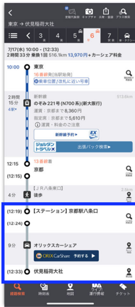
乗換案内アプリ・経路検索結果