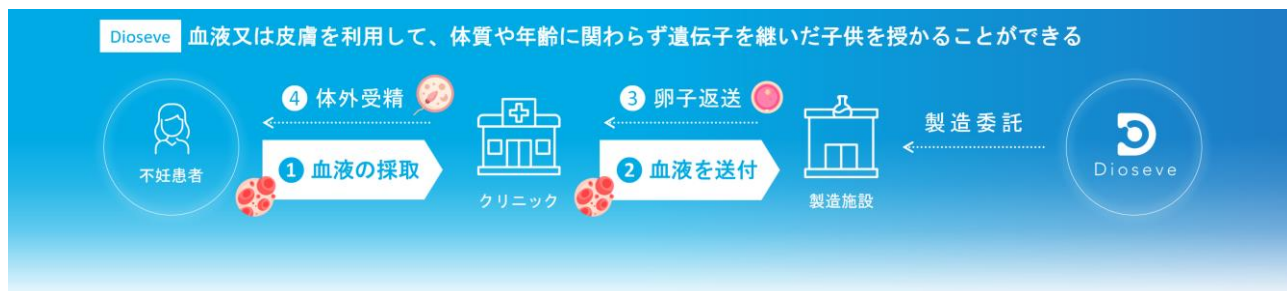
同社が提供するソリューション（イメージ図）

Dioseve は、iPS 細胞を短期間で安価に、かつ大量に卵子（卵母細胞）に分化誘導することができる極めて革新的な技術を保持しており、同社は、本技術を応用することで、人々が年齢や体質に関係なく子どもをもつことができる社会を目指しています。日本国内における生殖補助医療の実施回数は過去 20 年程で飛躍的に増加しているものの、生殖補助医療の成功率はむしろ低下しています。その背景には、晩婚化の流れから以前よりも高齢での妊娠を望むカップルが増えていることが一因と考えられます。同社の技術は、現在の治療法を劇的に変革することで、夫婦やカップルに多様な選択を提供することを目指すものです。