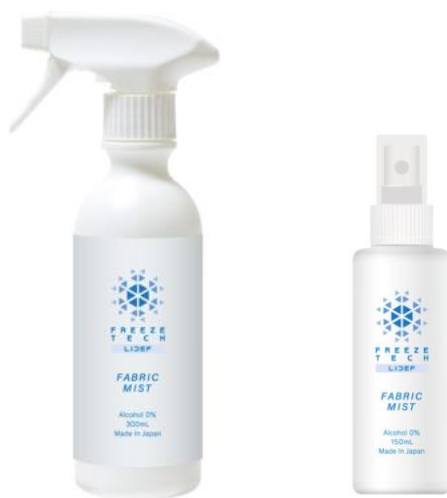
左：FREEZE TECH 衣類用冷感ミスト 300ml