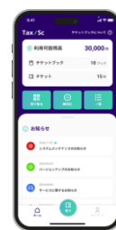
【タクスク®・アプリ】

チケット利用者は、「タクスク®」が提供する専用スマホアプリ「タクスク®・アプリ」を利用することで、アプリ上で電子チケットを受け取ることができ、紙製タクシーチケットのように紛失する心配がありません。また、タクシー降車時に電子チケットを利用することで、従来のタクシーチケットと同様に、タクシー代をチケット申込者による後払いにすることができます。