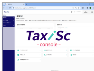
【タクスク®・コンソール】

本サービスの申込者（チケット管理者）は、「タクスク®」が提供する専用 Web 管理画面「タクスク®・コンソール」を使用して、オンライン上で利用予定（金額や期限）に合わせた電子チケットを即時作成することができます。また、作成した電子チケットをオンライン上でチケット利用者に譲渡したり、不要な電子チケットを無効化したり、保有者や利用状況をリアルタイムに把握することができるので、電子チケット全体の一元管理が可能となります。