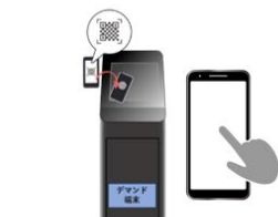
固定型予約端末機及びWeb予約システムの導入