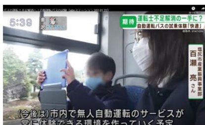
(今後は)市内で無人自動運転のサービスが 富に体験できる環境を作っていく予定 自動運転を研究する親子の試乗(ABN放送)