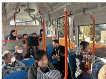
幼稚園児・高齢者・移住者家族を含む試乗