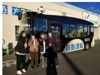
毎朝自動運転バスにて登校した高校生