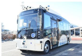
ティアフォー製Minibus導入