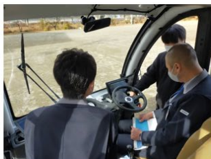
地域人材による運行体制構築