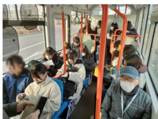
2日目以降、朝3便目はほぼ満席