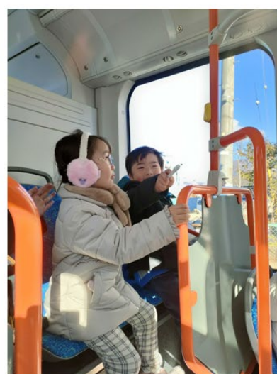
毎日乗車した幼稚園児