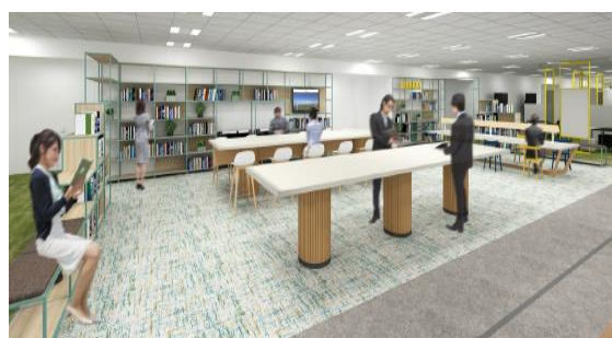
13 階イノベーションを生み出すライブラリー