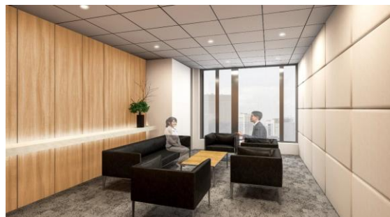
14 階不燃間伐材を活用した応接室