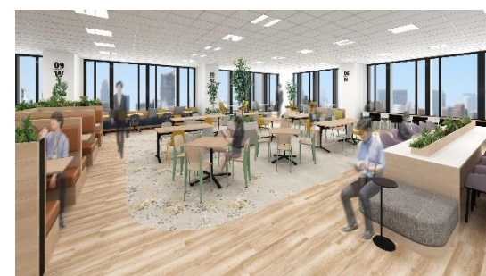
13 階フランクな交流を促すリフレッシュエリア