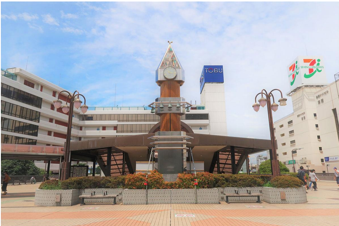
【1位船橋】船橋駅周辺やベイエリアには大型商業施設が揃い、買い物やレジャーの選択肢が豊富

今回の調査では、前回調査（2023年11月）で2位だった「船橋」が、ランクを上げて首位を獲得し、ニフティ不動産ユーザーの高い注目を集めた結果となりました。