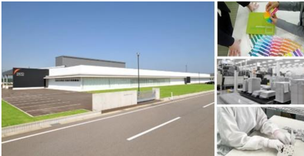
印刷・パッケージング会社として常に独自の技術開発に努め、包装機能と企画・情報を提供していきます。

(タイヨーパッケージ: https://taiyopackage.co.jp/ir/ )