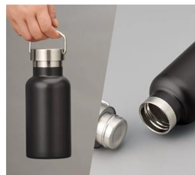
メタルハンドルサーモボトル