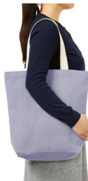
シャンブリック キャンバストート