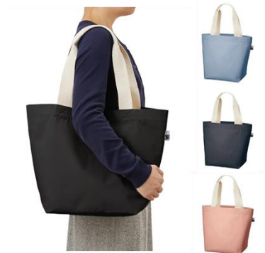
コットンキャンバストート