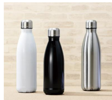
ロケットサーモボトル