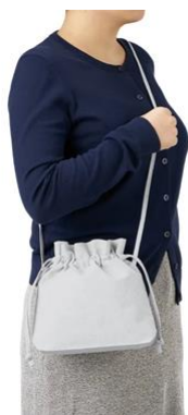
シャンブリック巾着 ショルダーバッグ