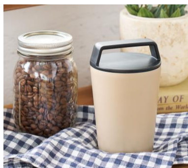
ハンドルサーモステンレストンブラー