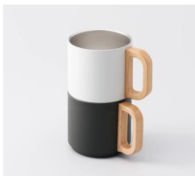
ハンドルサーモスタッキング