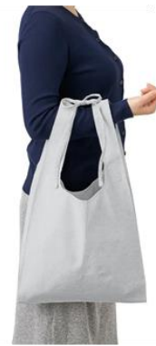
シャンブリック紐付 マルシェバッグ