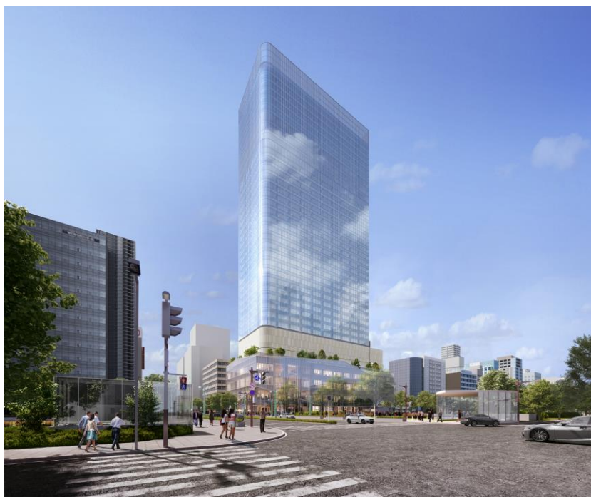
建物外観イメージパース