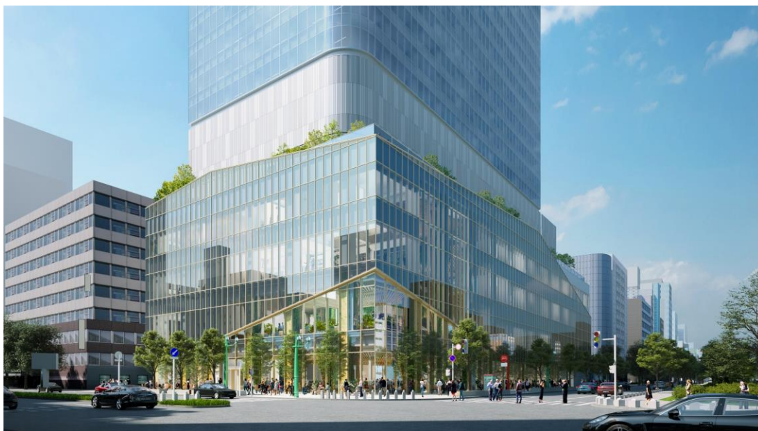
低層部外観イメージパース