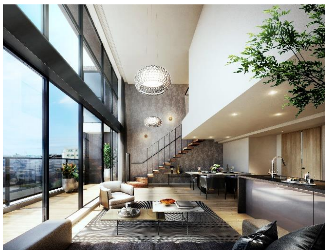
リビング・ダイニング・キッチン完成予想図Tタイプ (※11)