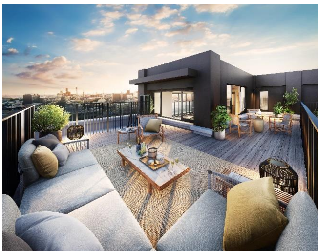
ルーフバルコニー完成予想図Zタイプ (※11・12)