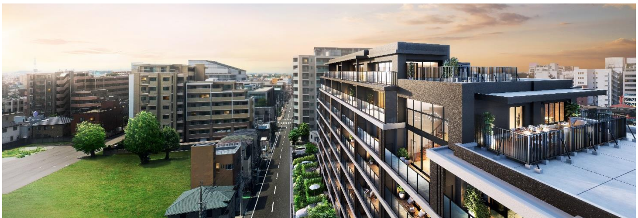
左上：外観完成予想図 右上：エントランスアプローチ完成予想図(※3) 下：借景外観完成予想図(※4)