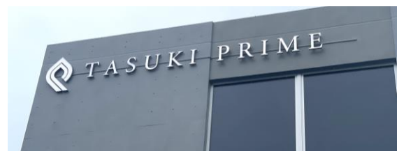
▲TASUKI PRIME 平和島