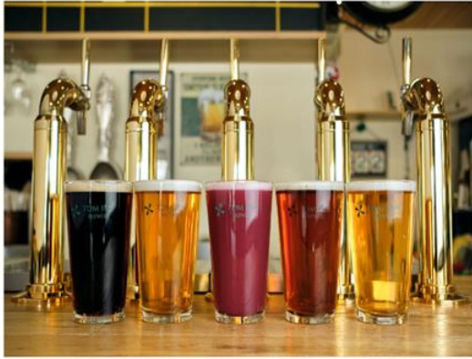
●TDM 1874 Brewery