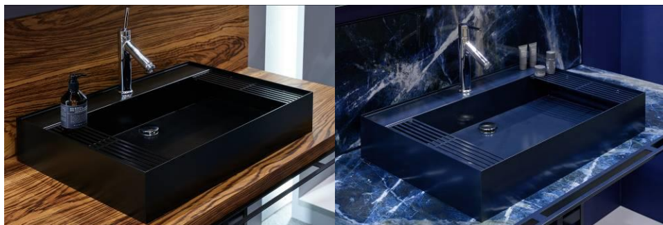
▲展示会出品品として3社共同開発した「システム洗面化粧台」

また、今回のシステム洗面台の出展に際して、グループの住宅設備ブランドとして「暮らしはもっと自由になる。」をコンセプトに「CRAF FREE（クラフリー）」を冠し、出展をいたしました。今回出展いたしました洗面化粧台に限らず、他の住宅設備やインテリア・家具、エクステリア等、ライフスタイルに関連する製品のラインナップを今後拡充していきたいと考えております。