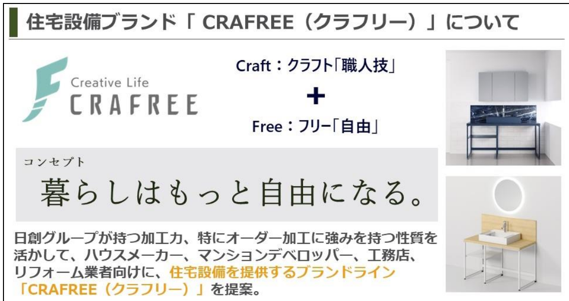
▲住宅設備ブランド「CRAF FREE（クラフリー）」について

また、今回のシステム洗面台の出展に際して、グループの住宅設備ブランドとして「暮らしはもっと自由になる。」をコンセプトに「CRAF FREE（クラフリー）」を冠し、出展をいたしました。今回出展いたしました洗面化粧台に限らず、他の住宅設備やインテリア・家具、エクステリア等、ライフスタイルに関連する製品のラインナップを今後拡充していきたいと考えております。