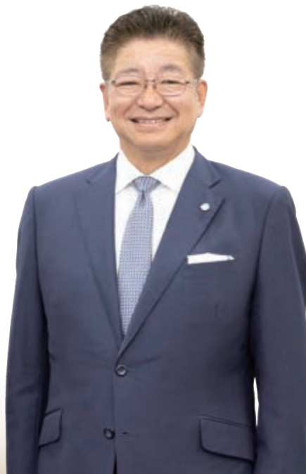
代表取締役会長（兼） エフピコグループ代表