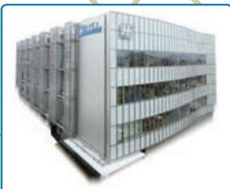
株式会社エフピコ 総合研究所