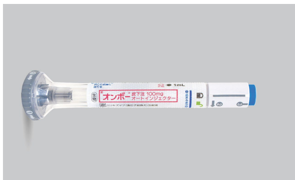
オンボア®皮下注 100mg オートインジェクター